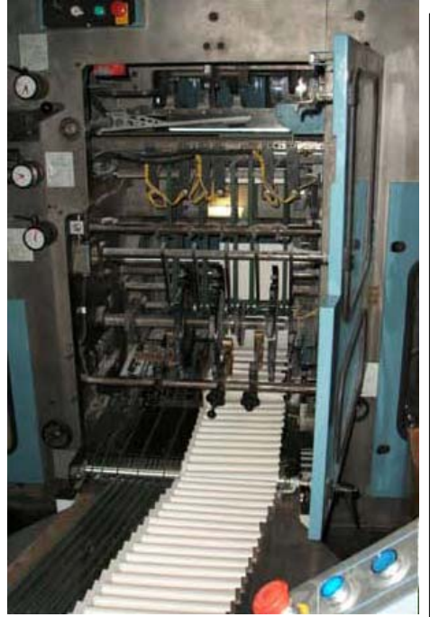
Painoarkit tasataan sidontakonetta varten