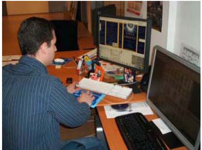
Painotyön valmistelua ja painolevyjen valottamista