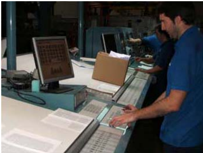
Etusivujen valmistus ja tarkastus