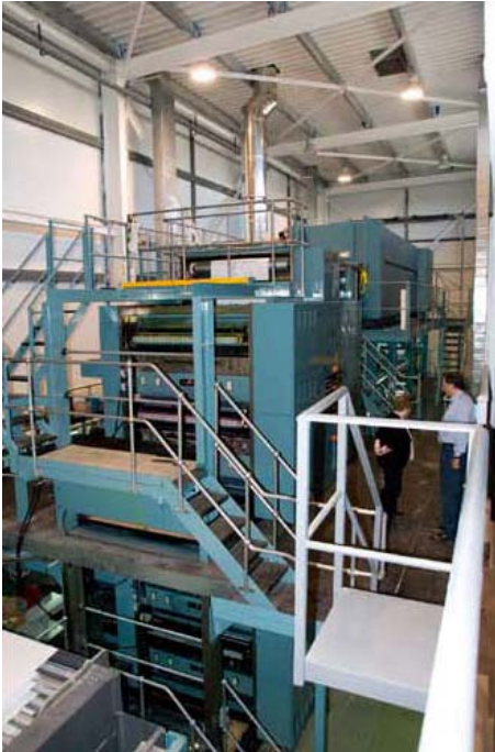
Simson Pressin ylätaso