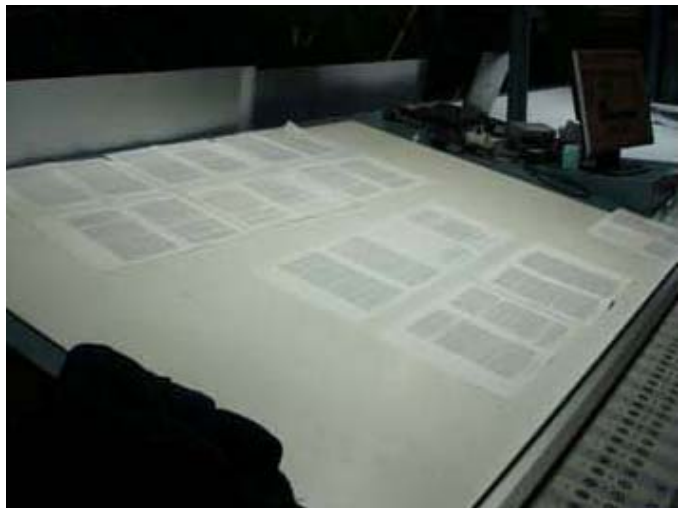
Etusivujen valmistus ja tarkastus