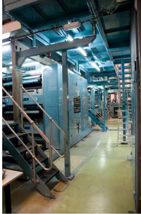
Simson Pressin alataso