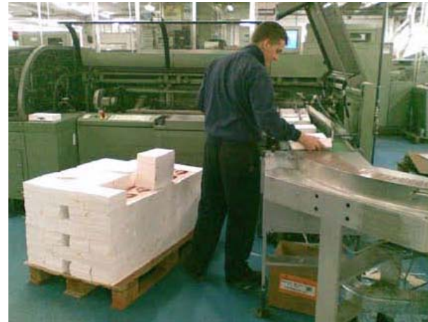
Kirjat kelmutetaan jakelua varten